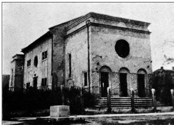
1. ábra: A felsógallai zsinagóga épülete

A helyi hitélet újraindítását azonban nem csak a személyi feltételek hiánya akadályozta, hanem súlyos károk érték a hitélet központjának tekinthető zsinagógát is. A szövetséges csapatok légiereje 1944. októberében támadást indított, amelynek egyik célpontja a tatabányai ipartelep volt. Az ipari létesítmények mellett bombatalálat érte a Szt. János utca néhány lakóépületét, valamint a zsinagógát is. A pontos veszteségekről keveset tudunk, a megmaradt levéltári dokumentumok kizárólag a felsógallai lakóépületekben keletkezett károkról és azok mértékéről tesznek említést. Az a tény, hogy a zsinagóga állapotáról ezen forrásokban nem találunk utalást szorosán összefügg azzal, hogy 1944. végére a hitközség tagjait már elhurcolták, így az épület sorsa iránt különösebb érdeklődés nem mutatkozott. Ez a közömbösség azonban 1947. után megváltozott. 39