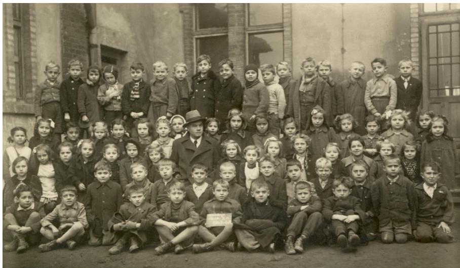
A Tatabánya I. Kerületi Bányatelepi Állami Általános Iskola II. a. osztályos tanulói az 1947/48-as tanévben 58

gyermek kiválasztásában is szerepet játszott. 56 A gyermekeket (267 fő) szállító vonatok, 1946 áprilisában indultak el a Sárospatak és Tokaj környéki településekre. A korszak közlekedési viszonyait jól mutatja, hogy a hétfő reggel elinduló szerelvények csak másnapra futottak be a borsodi állomásokra. 57