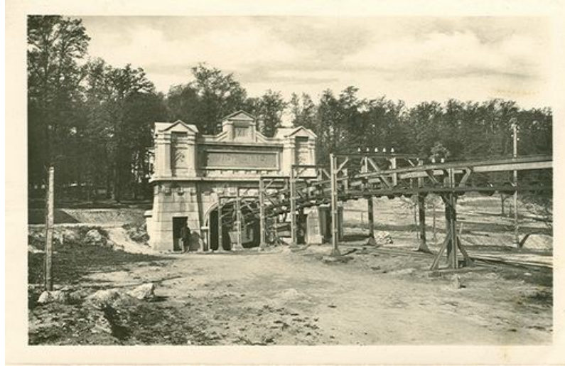
A Vida Jenő akna

nagyiroda segédtisztviselői tartoztak. A gyári, vállalati altisztek, művezetők némileg különböztek a katonai, közszolgálati, közlekedési és postai altisztektől. A gyári altisztek a legjobb szakmunkások közül kerültek ki és fontos funkciót töltöttek be a termelésirányításban. Létük kétségtelenül hozzájárult az üzemi társadalom hierarchikus tagolódásához, a munkásság megosztásához. Ők alkották a vállalatvezetés hű és szilárd bázisát és értékeik a polgári értékrendhez álltak a legközelebb. 22 Az elővájárok képezték az altisztek és a munkások közötti „átmeneti csoportot”. A MÁK Rt-nél alkalmazásban álló munkavállalók legnépesebb csoportjához a munkások tartoztak, akiknek közel 50%-a a bányamunkások (szén, kő, márga), a többiek pedig a külszíni munkások, az iparosok és a gépkezelők közé volt sorolható. 23