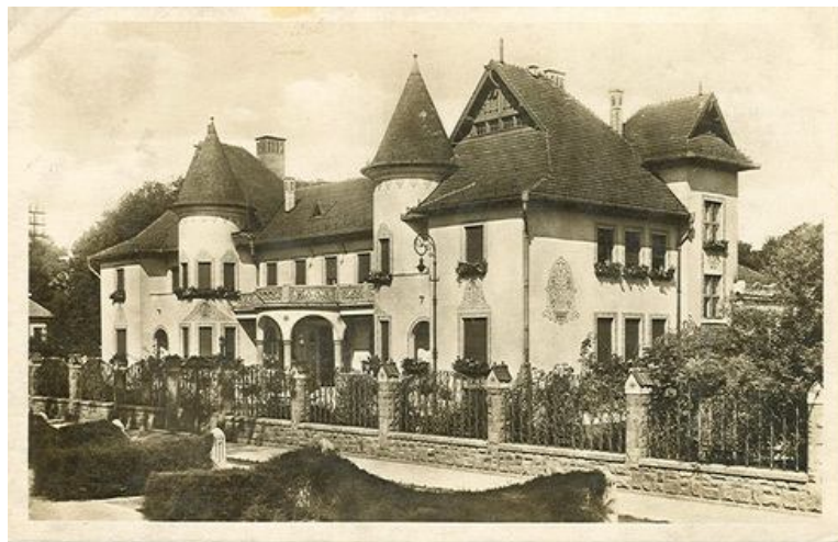
A tiszti kaszinó épülete

Egy 1940-es kimutatás szerint a vállalat 4.495.995,64 pengőt fordított szociális és kulturális célokra, melyből 99354,18 pengőt a Népház és a bányatelepeken működő egyesületek kaptak. A társulat által létesített és működtetett kulturális intézmények közül az egyik legjelentősebb az 1917-ben megnyitott Népház volt. Az épület 750 férőhelyes nagyterme kiválóan alkalmas volt színi- és mozielőadások, valamint hangversenyek tartására. A vállalat létesítette és tartotta fenn a kulturális élet központjainak számító munkás- és tiszti kaszinókat. A három telepi munkáskaszinónak 1940-ben összesen 1365 tagja és közel 4337 kötetes könyvtára volt. A munkáskaszinók nyújtotta szolgáltatásokat a bányamunkások közel egynegyede vette igénybe. 145 A kaszinói tagok újságot olvashattak, rádiót hallgathattak, biliárdozhattak, sakkozhattak és ismeretterjesztő előadásokon vehettek részt.