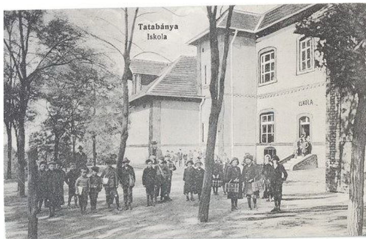
Társulati elemi népiskola

A vállalat nemcsak az iskolák létesítésével és fenntartásával kapcsolatos kiadásokat fedezte, hanem az alkalmazottak gyermekei részére ingyen biztosította az író- és tanszereket. A bányatelepi iskolákban folyó oktató és nevelőmunka sikerét és céljait jól jelzi az a tantestületi jegyzőkönyv is, amelyben megállapítják, hogy „a legintelligensebb, legokosabb gyerekek a telepen vannak, ahol azelőtt a szocializmus, a kommunizmus fészkelte, ott most az istenfélelem, hazaszeretet lépett a nyomába”. 132 Az oktatói munka eredményességét jelzi, hogy a bányamunkások 45%-a 6 elemi végzett. 133