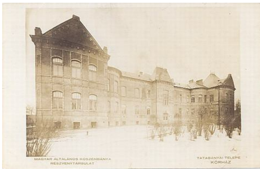
A bányakórház épülete

megszavazta. Az 1940-es évek elején a már meglévő épülethez további négy kórtermet építettek és ennek eredményeként a kórházi ágyak száma 189-re emelkedett. 97